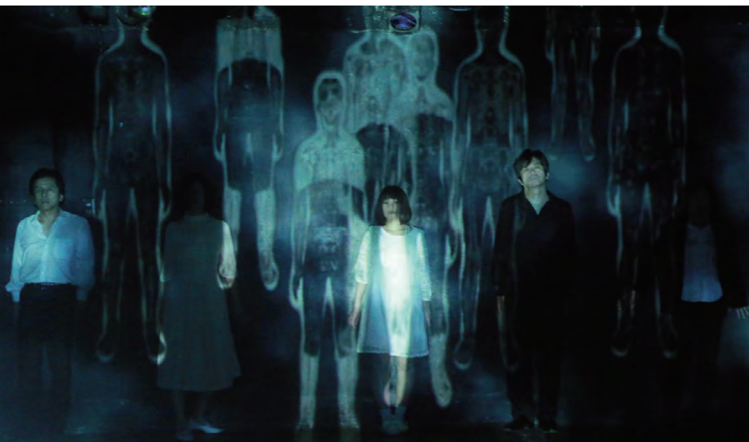
「Hamlets/ハムレッツ」 ver.1 (2015年3月/タイニイアリス)より

https://www.facebook.com/Tamaproject/?ref=hl